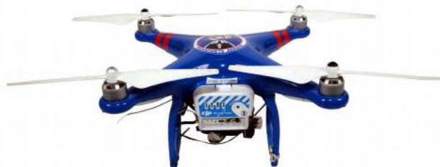
FRANCE – Drone de la Gendarmerie des transports aériens (don de la GTA)