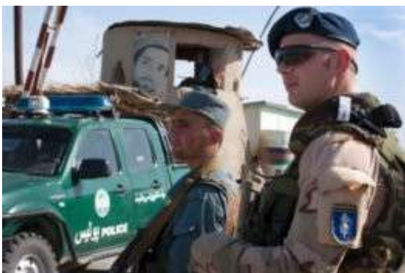
PAYS BAS - Maréchaussée néerlandaise en opération extérieure sous mandat de la force de gendarmerie européenne (FGE) en Afghanistan.