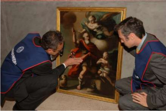
ITALIE - Le Comando Carabinieri Tutela Patrimonio Culturale dans sa mission de protection des biens culturels.