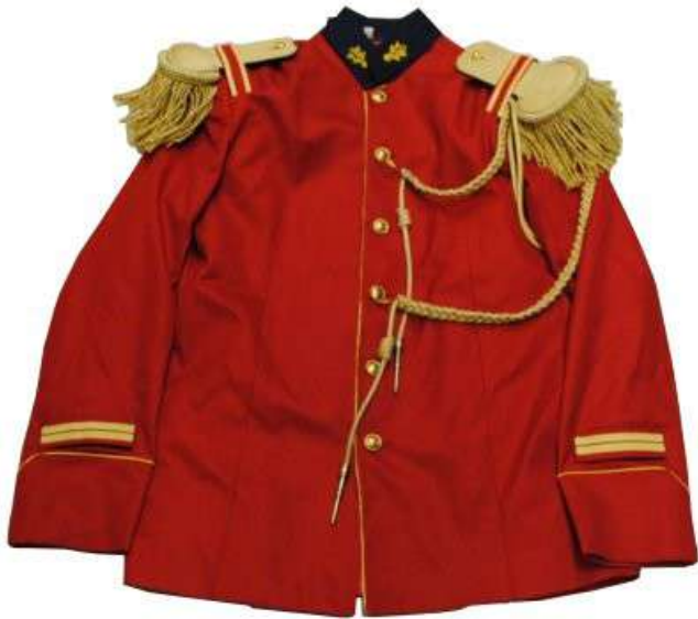
SENEGAL - Vareuse de cavalier de la Garde rouge (prêt de l'École des officiers de la gendarmerie nationale de OUKAM)