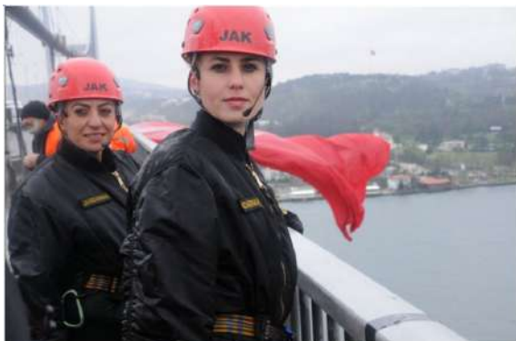
TURQUIE - Femmes de la Jandarma