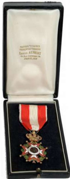
MONACO - Décoration Ordre de Saint Charles (prêt des Carabiniers du Prince)