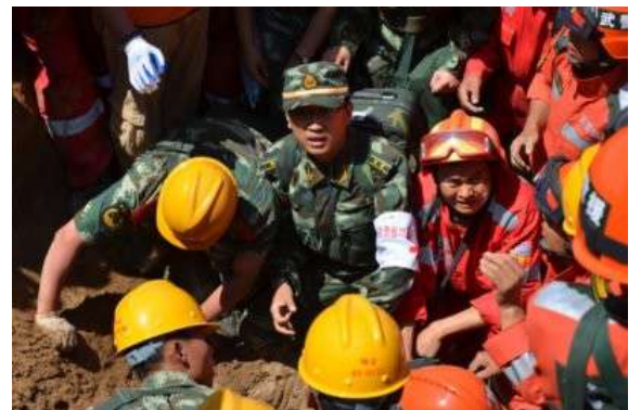
CHINE - Police Armée Populaire en mission de secours aux personnes, suite à un séisme.