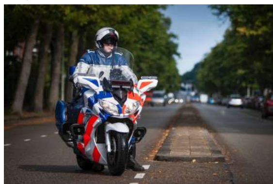
Motocycliste de la Maréchaussée néerlandaise en mission de police de la route

En matière d'environnement, le premier accord universel pour le climat approuvé à l'unanimité par les 196 délégations, lors de la COP 21 de Paris en 2015, a montré la sensibilisation croissante des États aux questions liées à l'environnement dans le monde. Plusieurs gendarmeries sont déjà engagées dans la voie de la protection de l'environnement, comme en Algérie, au Sénégal. Au Gabon, où 11 000 éléphants ont été tués depuis 2004, la gendarmerie a constitué des unités de parcs nationaux (3 compagnies et 13 « brigades de la jungle ») pour renforcer les agents locaux.