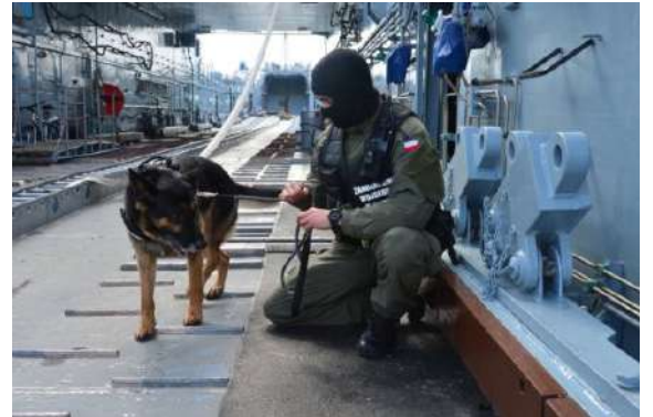
POLOGNE - Maître chien de la gendarmerie militaire