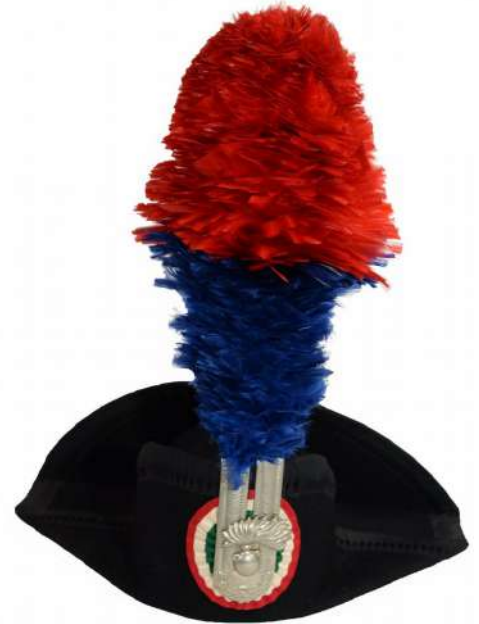
ITALIE - Chapeau de cérémonie de carabinieri italien (collection SPM Musée de la gendarmerie)