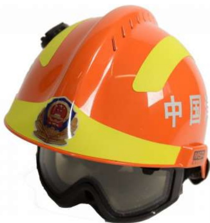
CHINE – Casque de secouriste de la Police Armée Populaire (don de la PAP)