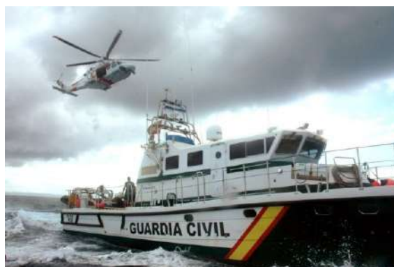
ESPAGNE – Intervention en mer par un bateau de la Guardia civil