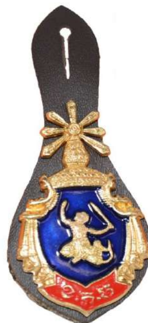
CAMBODGE – Insigne métallique général de la gendarmerie royale du Cambodge (don de la gendarmerie royale du Cambodge)