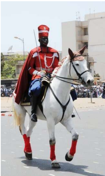
SENEGAL - Cavalier Garde rouge du Sénégal en grande tenue