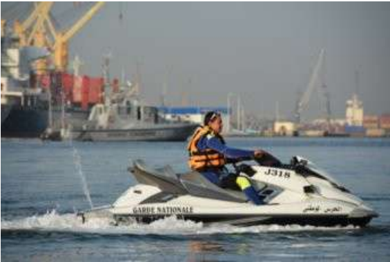
TUNISIE - Jet-ski de la garde nationale