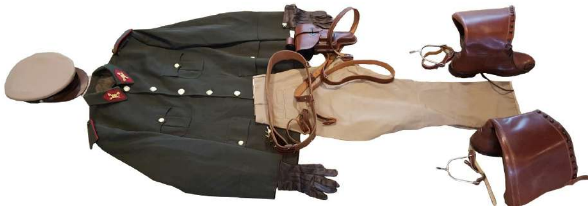
ARGENTINE – Tenue complète de cavalier carabinier argentin (prêt des Carabiniers argentins)