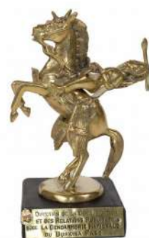
Burkina Faso, Yennenga

Le pouvoir confié par l'État aux gendarmes du monde est également visible, de manière plus symbolique, à travers leurs uniformes et leurs insignes. Les nombreux insignes et tenues envoyés par les partenaires étrangers au musée témoignent aussi de la richesse des représentations militaires. Certains insignes s'inspirent directement de l'histoire culturelle du pays, comme au Burkina Faso où la cavalière Yennenga, princesse légendaire fondatrice du royaume Moogo, a été choisie par la 3 e région de gendarmerie.