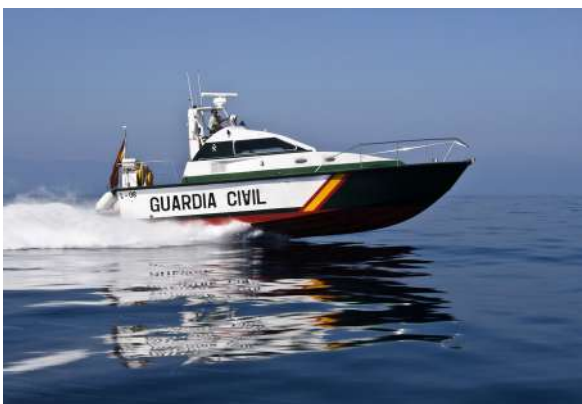
Intervention en mer de la Guardia civil - Espagne

Construire la nation et maintenir la cohésion nationale est la fonction fondamentale d'une gendarmerie. L'implantation organisée en petites unités sur tout le territoire répond à cet objectif. Ainsi, par exemple, au Bénin et à Madagascar, la gendarmerie couvre 90 % du territoire où vit 81 % de la population. Ce maillage territorial conduit les gendarmes du monde à être présents dans des milieux très variés allant