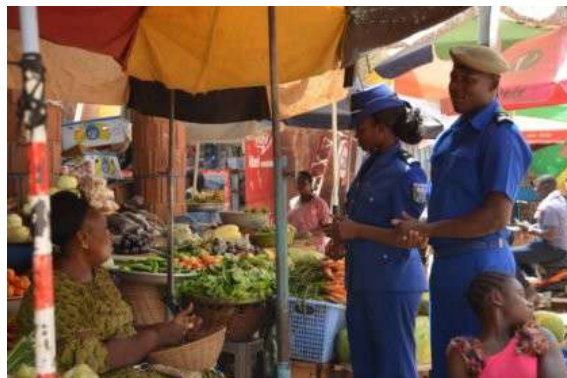
BURKINA FASO – Gendarmerie du Burkina Faso au contact de la population sur un marché.