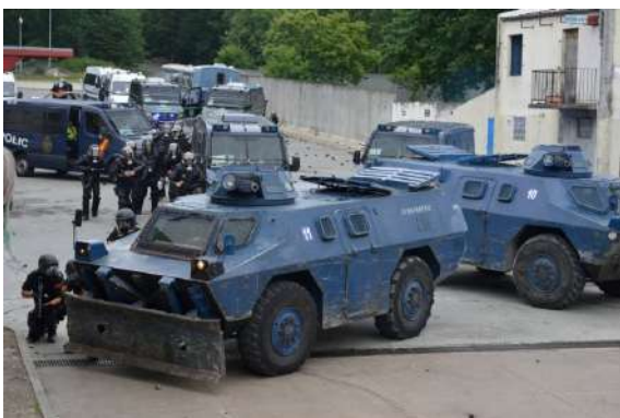
FRANCE - Entraînement de différentes délégations étrangères au Centre national d'entraînement des forces de gendarmerie à Saint-Astier