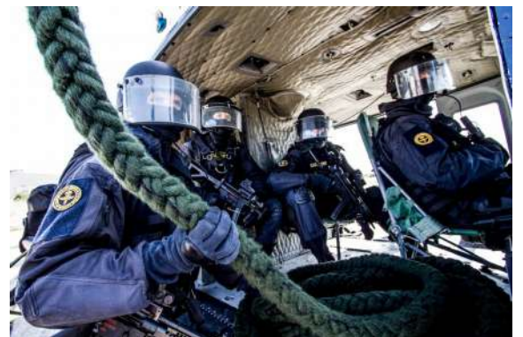
ITALIE - Groupe d'intervention des carabinieri italiens, le GIS, en mission à bord d'un hélicoptère.