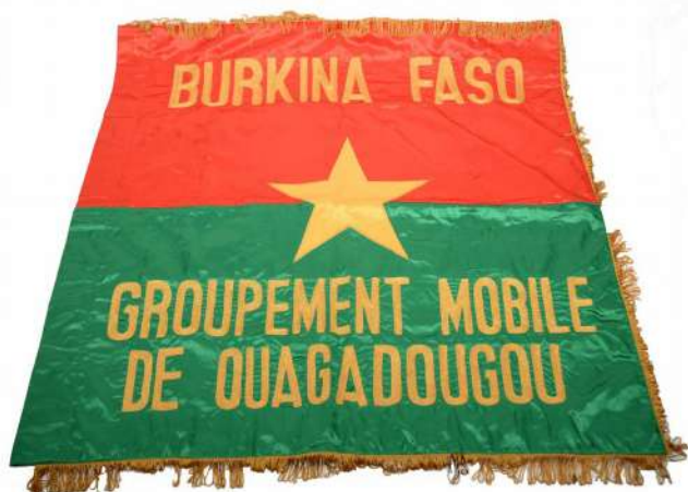
BURKINA FASO – Fanion du groupement mobile de Ouagadougou (prêt de la gendarmerie du Burkina Faso)