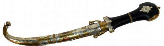
JORDANIE - Poignard d'apparat (don du Directeur général de la gendarmerie nationale française)