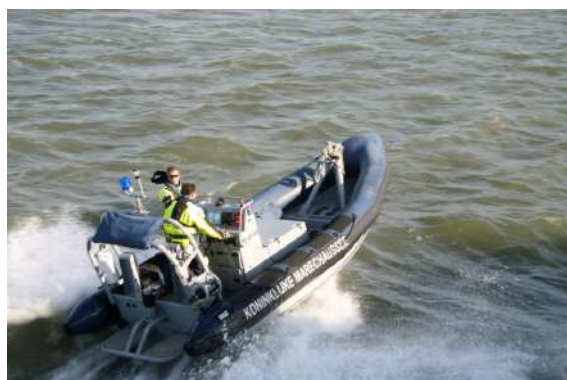
PAYS BAS – Intervention maritime de la maréchaussée néerlandaise