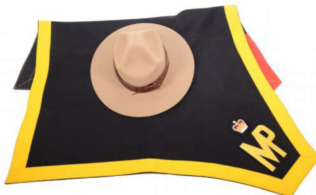
CANADA - Stetson et tapis de selle d'un cavalier de la gendarmerie royale canadienne (prêt de la GRC)