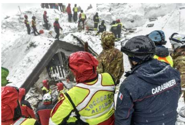
Secours en montagne, Carabiniers italiens

Même s'il existe des services spécialement dédiés à cette mission, le secours aux populations en danger fait partie des missions élémentaires des gendarmes dans le monde. Lors de catastrophes survenues ces dernières années, des gendarmeries se sont distinguées à plusieurs reprises. En Chine, la Police Armée Populaire (PAP) est intervenue lors des tremblements de terre qui ont frappé le Yunnan et le Sichuan où le séisme de 2008 a fait plus de 80 000 morts. Une tenue de sauveteur chinois avec son chien a été spécialement prêtée par la Chine pour l'exposition.