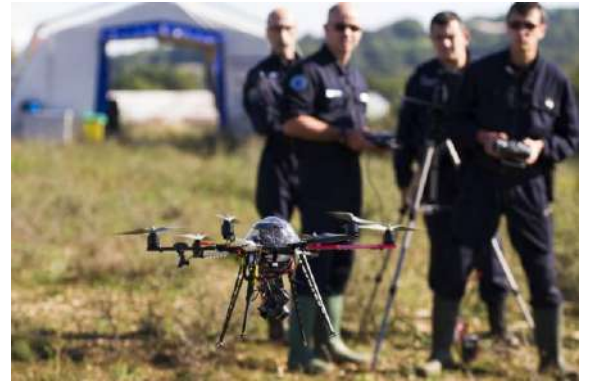
FRANCE - Gendarmes de l'Institut de recherche criminelle pilotant un drone à des fins de recherche.